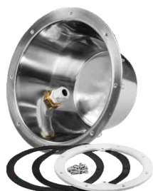
kod 314370-1 puszka lampy Stainless Edition

Wykonana ze stali AISI-316. Kompletną lampę tworzą: puszka + wkład lampy z żarówką TebasLED lub Diamond PLUS. Napięcie żarówek wynosi 12 V. Dostępny jest też wkład lampy bez żarówki do montażu dowolnej żarówki.