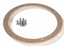
kod 314110 kołnierz uszczelniający