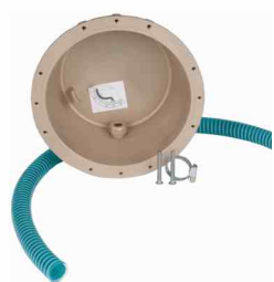
kod 314196 puszka lampy Bronze Edition

Kompletną lampę tworzą: puszka z brązu + wkład lampy ze stali z żarówką TebasLED lub Diamond PLUS. Napięcie żarówek wynosi 12 V. Do basenów foliowych należy zastosować kołnierz uszczelniający puszkę.