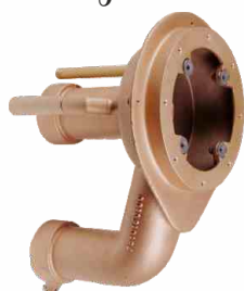
do Tajfun Jet głębokość 24 cm 374200