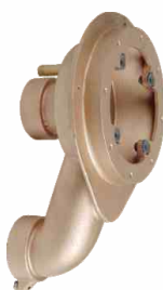
do Tajfun Jet głębokość 15 cm 374205