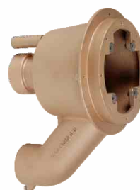
do Tajfun Duo Jet głębokość 24 cm 374710